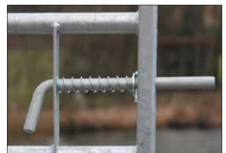
Art. nr. 59081: Grendel voor metalen landhek.