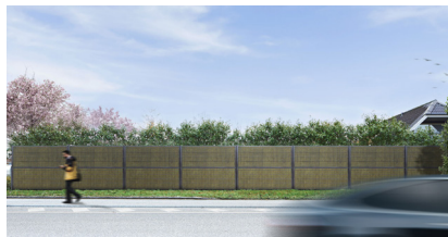
Antraciet RAL 7016