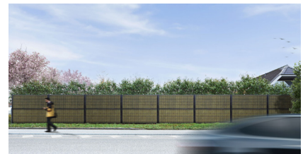
Zwart RAL 9005